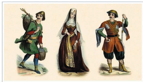
Грузинские типы. Рисунки Георгия Березина

Сами грузины величают себя картвелеби, а свою родину – Сакартвело, храня память о легендарном прародителе нации Картлосе. Этот древний народ Закавказья, представляющий картвельскую языковую семью, формировался на основе трёх крупных близкородственных племён: картов, мегрело-чанов и сванов. Сегодня собирательным названием "грузины" обозначают общность порядка 20 субэтносов, имеющих свои диалекты, культурные и бытовые особенности.