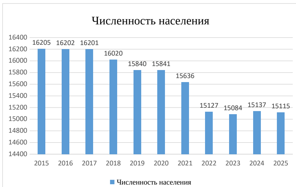
Рис. 1 Численность постоянного населения, городского округа Рефтинский (на начало года), человек

Динамика численности постоянного населения городского округа Рефтинский приведена на рисунке 1.